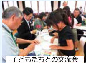
子どもたちとの交流会

小・中学生の登下校時の見守りや声掛け、行事などへの参加・協力のほか、子育てに関する関係機関と連携し、適切な支援を行います。