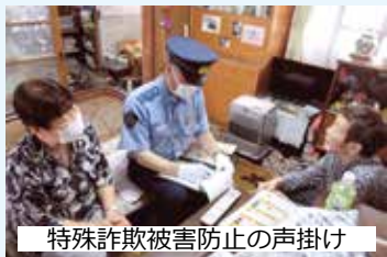
特殊詐欺被害防止の声掛け